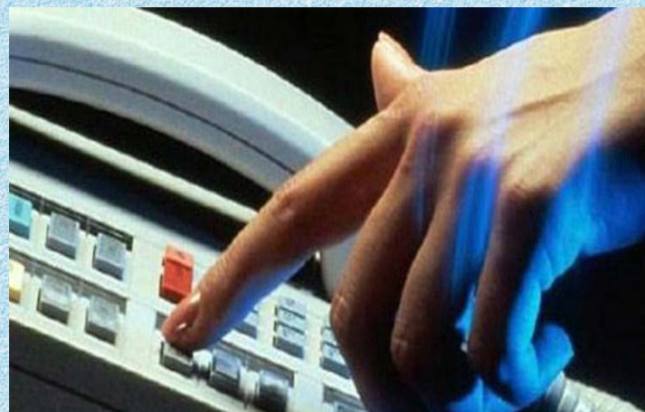
Sử dụng điện thoại cơ quan vào việc riêng gây lãng phí

(Khoản 1, khoản 2 Điều 1 Nghị định số 58/2015/NĐ-CP)